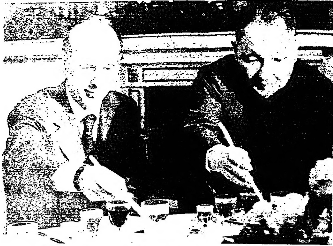
باريس - من نيل حبيقة :

ملاذعني بالنسبة الى الفرنسي المعادي لزيارة القبط الاول رئيس وزراء الصين نافع تسونج ينجغ ؟ « زيارة مهمة جدا ، تاريخية .. » قال لي رجل خمسيني حارب في الهند الصينية .